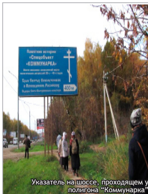
Указатель на шоссе, проходящем у полигона "Коммунарка"

Каков же характер Сергея Эфрона, известного по своим не только полярным устремлениям, но и поступкам, роковым образом ведшим его к гибели? Казалось, он нёс в себе рок и даже торопил его... Характер Сергея был неуловим в своих тончайших противоречиях, незаметно сменяющихся. Он был общительным, но скрытным – это свойство очень пригодится ему. Он мог быть «зыбким» – и одновременно страшно твёрдым, робким – и решительным, колеблющимся и непреклонным. Не эта ли