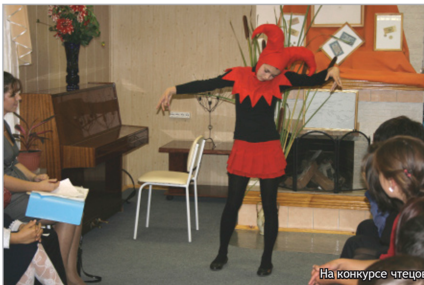
На конкурсе чтецов

В этом году конкурс проходил уже в четвертый раз и отродно было видеть среди конкурсантов тех, кто не впервые переступил порог Библиотеки в качестве чтеца.